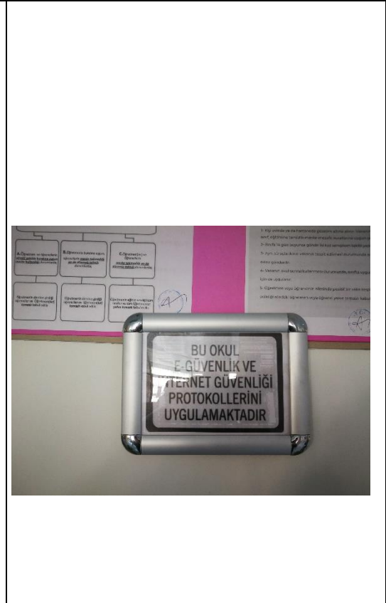
Okul Güvenlik Politikası Uyarıları